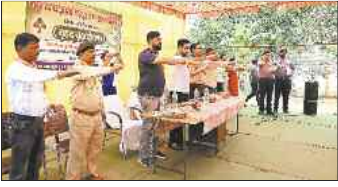
शपथ लेते कलेक्टर व अन्य।