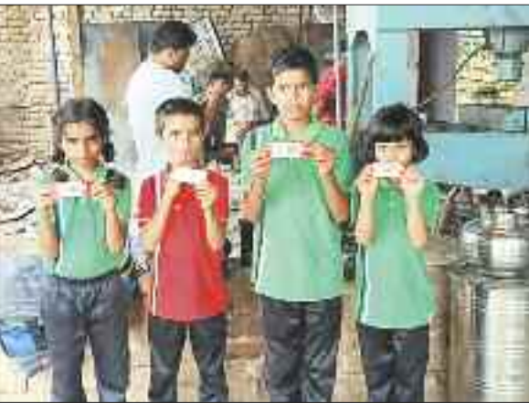
बच्चों को दिए गए एक्सपायरी मिलेट्स बार।

बार को स्कूली बच्चों को बांट दिया। जिसकी वजहता एक महीना पूर्व खत्म हो गई थी। घटना की जानकारी लगने पर अखिल भारतीय विद्यार्थी परिषद पदाधिकारी व कार्यकर्ताओं ने जिला शिक्षा अधिकारी से की है। वहीं परिजन भी स्कूल प्रबंधन की लापरवाही करने पर नाराजगी जाहिर की है। अभाविय के विभाग संयोजक