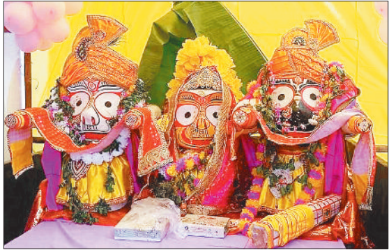
विराजे भगवान जगन्नाथ।