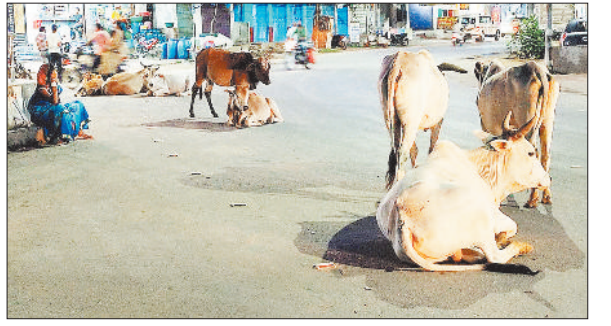
मुख्य मार्ग सहित अन्य मार्गों पर परेशानी

हरिभूमि न्यूज | बैकुण्ठपुर शहर के विभिन्न क्षेत्रों की सड़कों पर आवारा पशुओं के विचरण करने के कारण लोगों को हमेशा ही दिक्कतों का सामना करना पड़ता है। यह समस्या शहर की पुरानी समस्याओं में से एक है, इसके निदान के लिए अब तक ठोस पहल नहीं की गई है। हाल में मुख्य नगर पालिका अधिकारी ने शहर की सड़कों को पशुओं से मुक्त करने के लिए अधिकारियों एवं कर्मचारियों की टीम बनाया है, जो सड़कों में विचरण करने वाले पशुओं को हटाने की दिशा में कार्य करे, इसके बावजूद शहर के विभिन्न क्षेत्रों में पशुओं के विचरण के कारण लोगों को परेशानी बनी हुई है। शनिवार को शाम ढलने के बाद शहर के फव्वारा चौक के पास सड़क पर कई मवेशी बैठकर आराम करते रहे और देर तक उक्त स्थल पर मवेशियों का जमावाड़ा रहा। इसी तरह इस दिन शाम ढलने के बाद रात्रि में पुगने बस स्टैंड परिसर में भी कई आवारा पशु विचरण करते रहे, वहीं कुछ बैठे नजर आए। इस तरह की समस्या से शहर के लोगों को रोज-दो-चार होना पड़ता है। मुख्य मार्ग पर आवारा पशुओं के कारण दुर्घटना की