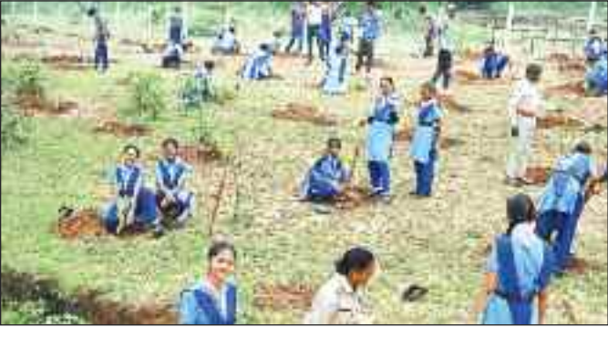
उपरिष्ठ स्काउट गाइड।