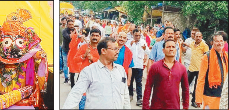
रथयात्रा में शामिल श्रद्धालु।

जगन्नाथ रथयात्रा देशभर में निकाली जाती है। इस रथयात्रा का विशाल आयोजन उड़ीसा के जगन्नाथ मंदिर से प्रारंभ होता है। इस वर्ष यह रथयात्रा रविवार से शुरू हुई, जो देवश्यानी एकादशी के दिन समाप्त होगी। भगवान जगन्नाथ के रथयात्रा में उनके भाई बलभद्र एवं बहन सुभद्रा भी शामिल होती है। शहर में