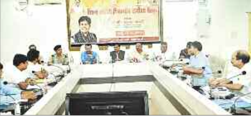
बैठक को संबोधित करते प्रभारी मंत्री।

बता दें कि शुक्रवार को प्रदेश के वित्त व जिले के प्रभारी मंत्री ओपी चौधरी पहली बार सरगुजा पहुंचे थे। इस दौरान उन्होंने कलेक्टरों से सभाकक्ष में विभागीय समीक्षा बैठक की। उन्होंने कहा कि सरगुजा के